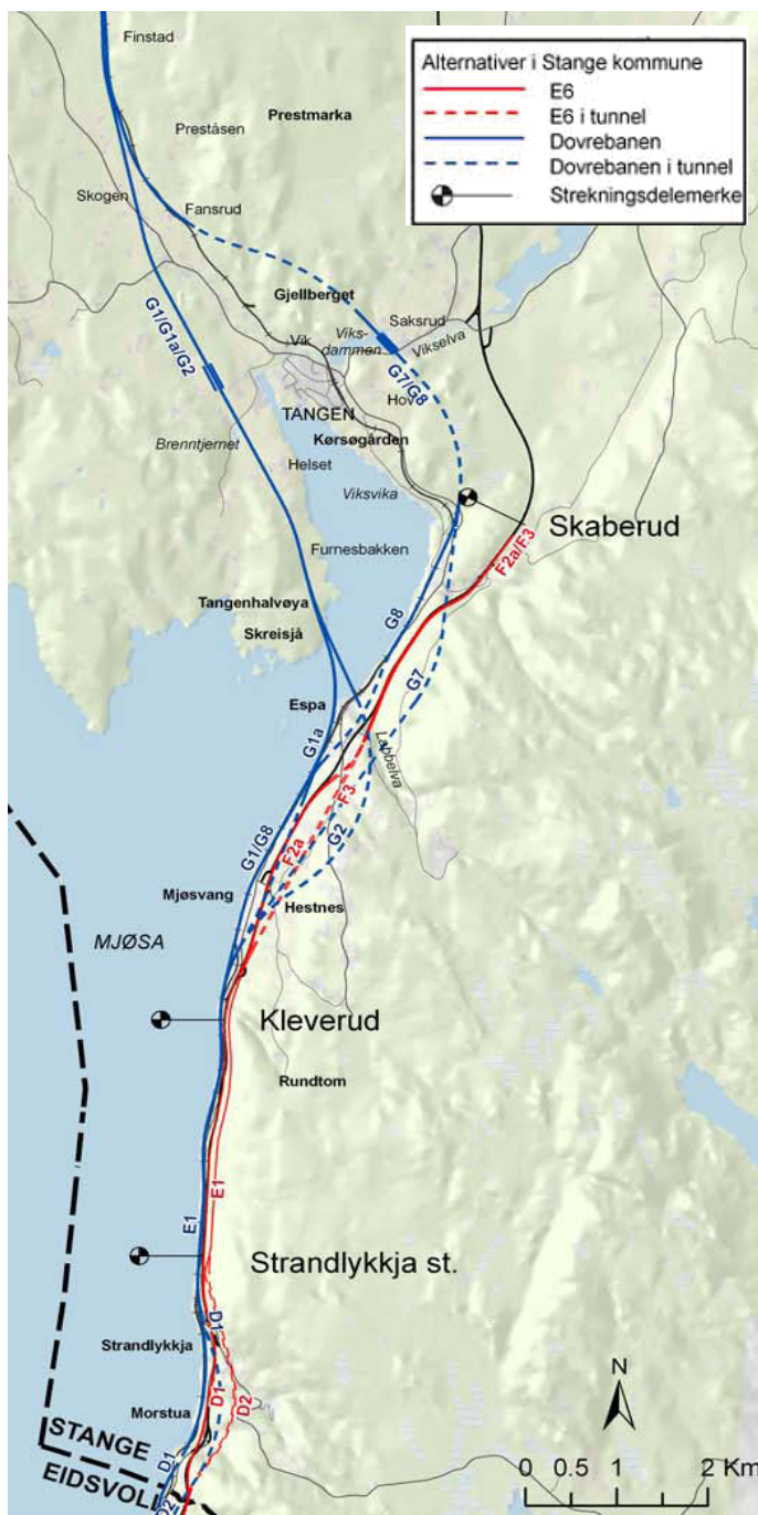
Bilde 2. Viser forskjellige alternative traseer for E6 og Dovrebanen i Stange kommune (Fellesprosjektet E6 – Dovrebanen 2009).

Statens vegvesen og Jernbaneverket har i samarbeid med kommunen utarbeidet forslag til kommunedelplan med konsekvensutredning for utvidelse av E6 til 4 felt mellom Hedmark grense og Skaberud, og nytt dobbeltspor for Dovrebanen mellom Hedmark grense og Sørli i Stange kommune. Dette er en del av arbeidet med utvidelse av E6 til 4 felt mellom Gardermoen i Ullensaker og Kolomoen i Stange, og dobbeltspor for Dovrebanen mellom Eidsvoll og Hamar (Fellesprosjektet E6 – Dovrebanen 2009).