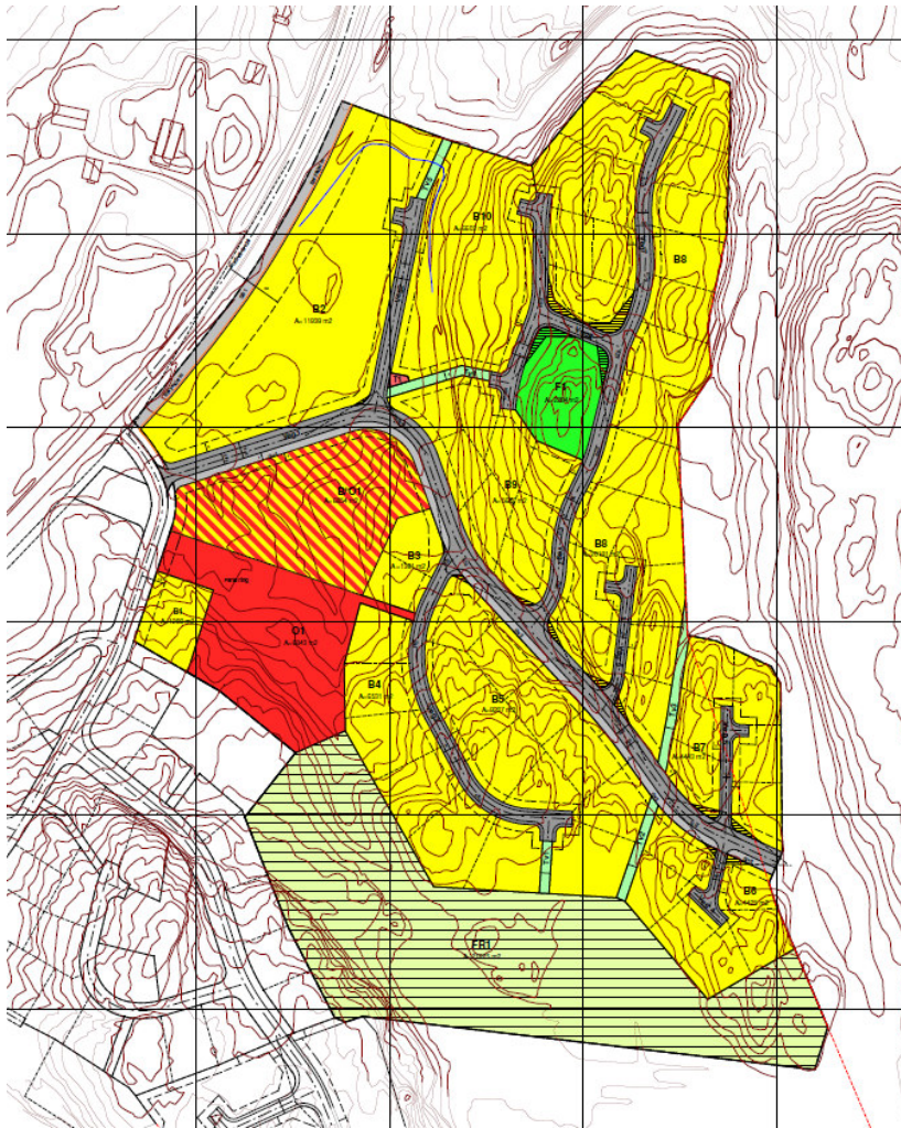
Bilde 1. Viser omfang av reguleringsplan for Augerød 3 (Våler kommune 2007)

Planstiller tok kontakt med kommunen som innledende prosess i planleggingen. Partene gjennomgikk bestemmelser i kommuneplanen for området. Erfaringer fra reguleringsplanarbeidet ved Augerød 1 og 2 ble gjenstand for drøfting. Dette møte var et uformelt møte mellom utbygger/planstiller og kommunen som planmyndighet. Etter denne kontakten ble planen offentliggjort i tråd med bestemmelsene i plan- og bygningsloven. Varselet ga offentligheten og andre myndigheter informasjon om det planlagte tiltaket og det ble gitt mulighet til å komme med innspill.