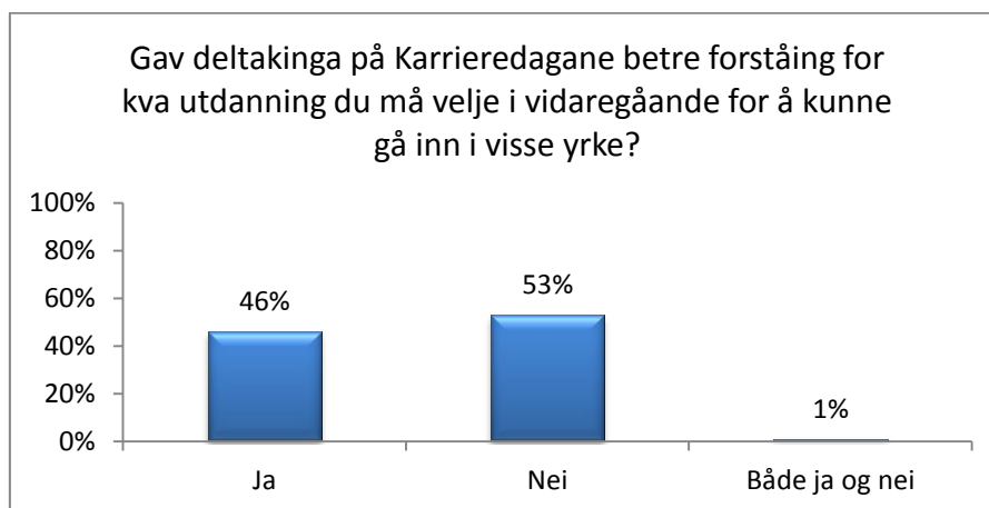
Figur 2. Svar på spørsmålet: Gav deltakinga på Karrieredagane betre forståing for kva utdanning du må velje i vidaregåande for å kunne gå inn i visse yrke? Basert på svar frå ungdomar i fire 10. klassar i Møre og Romsdal. N=89.

Eit sentralt mål med Karrieredagane er at elevane skal få kunnskap om og sjå konkrete døme på samanhengar mellom visse yrke/bransjar, utdanningsprogram og utdanningsretningar. Figuren nedanfor viser om elevane meiner dei fekk betre forståing for den samanhengen.