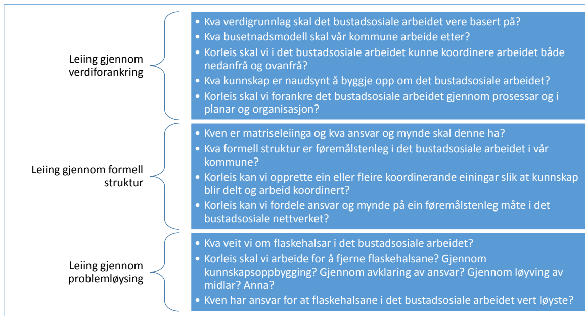
FIGUR 9 SUMMERER OPP SPØRSMÅL MATRISELEIINGA MÅ TA STILLING TIL INNAFOR OVERSKRIFTENE VERDIFORANKRING, FORMELL STRUKTUR OG PROBLEMLØYSING.

«Verdibasert matriseleiing» er ikkje eit ferdig utvikla konsept. Vi har valt å løfte fram matriseleiing nettopp fordi det er lite kunnskap om det, fordi det viser seg å vere avgjerande for kommunane i det bustadsosiale arbeidet, fordi det er stort behov for at «nokon» koordinerer innsatsen i ein kommune og fordi nettverksleiaren (prosjekt- eller programleiaren) ikkje kan gjere dette åleine i ein samansett organisasjon.