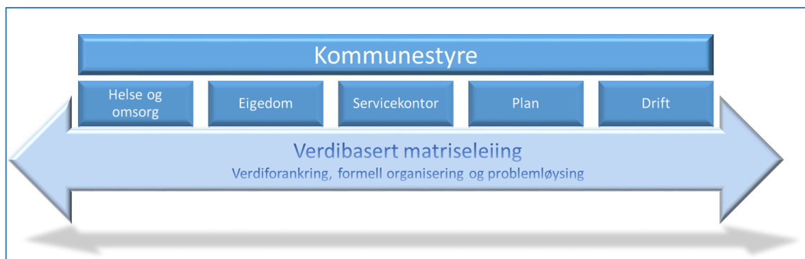
FIGUR 4 VISER EIN MODELL FOR VERDIBASERT MATRISELEIING I KOMMUNANE. MÅLSETJINGA MÅ VERE EIN KONTINUERLEG KOORDINERING AV DET BUSTADSOSIALE FELTET. VÅRE ERFARINGAR VISER AT EI SLIK VERDIBASERT MATRISELEIING KAN NYTTE VERDIFORANKRING, FORMELL ORGANISERING OG PROBLEMLØYSING SOM KOORDINERANDE ELEMENT.

I ei langsiktig koordinering på tvers meiner vi at dei verdibaserte elementa vil vere viktigare i matriseorganisasjonen enn i linjeorganisasjonen sidan dei ikkje i like stor grad er støtta av formelle struktur. Verdigrunnlaget for det bustadsosiale arbeidet legg føringar både for måla med arbeidet og for måten arbeidet skal drivast på. Eit felles verdigrunnlag bør vere forankra både politisk og administrativt i kommunen, og helst også formidla til aktørar som kommunen samarbeider med i det bustadsosiale arbeidet. Relevante spørsmål for matriseleiinga er: Kva vil vi oppnå med det bustadsosiale arbeidet? Kva skal prege tenestene? Korleis skal vi jobbe? Kva haldning skal vi ha til menneske som er omfatta av bustadsosialt arbeid? For å kunne skape eit felles verdigrunnlag i kommunen, må det etablerast ei felles forståing av kva bustadsosialt arbeid er, og av kva rolle ulike tenester har i arbeidet. Denne forståinga må også vere forankra hos politikarane, og helst også hos aktørar utanfor kommunen som er viktige i det bustadsosiale arbeidet.